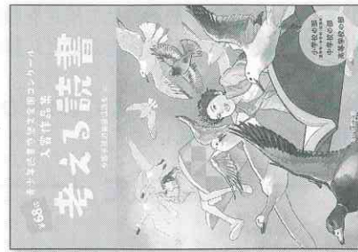
※第68回作品集 昨年度