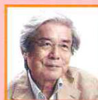
養老孟司 東京大学名誉教授 /解剖学者