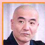
玄侑宗久 作家 / 福聚寺住職