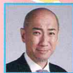
熊切大輔 日本写真家協会会長