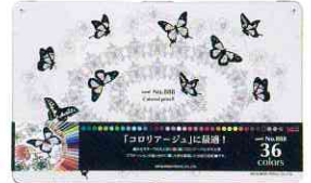
副賞の三菱鉛筆色鉛筆 No.888<36色セット>