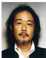
リリー・フランキー イラストレーター 作家・俳優など