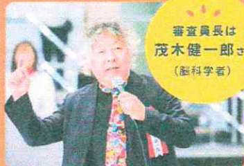
審査員長は 茂木健一郎さん (脳科学者)